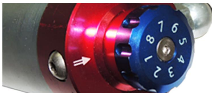
Possui 8 regulagens para Bump (compressão)